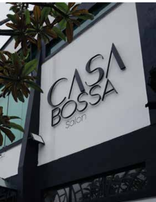
“Casa Bossa”, legado de valores, sensibilidade e um olhar profundamente humano para a beleza.