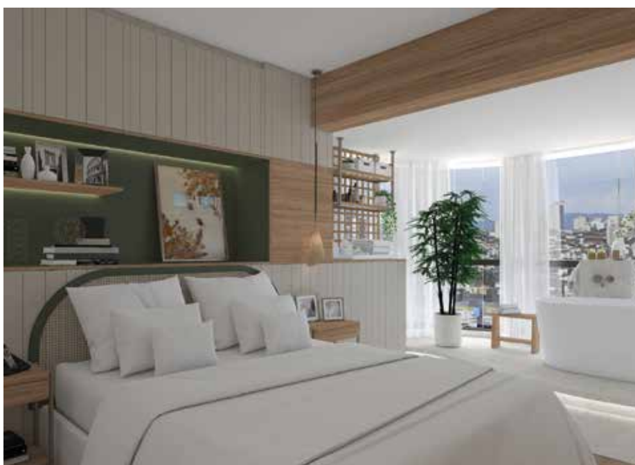
Projeto de quarto de casal, idealizado para ser o ambiente mais íntimo da casa.