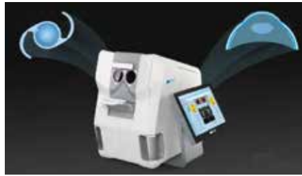
Tomógrafo de coerência óptica (OCT) Eyestar 900.

Ele utiliza a tecnologia OCT Swept-Source, que permite imagens transversais de alta resolução, medindo estruturas desde a córnea até a retina com extrema precisão. Para o paciente, isso significa um cálculo mais seguro da lente intraocular (LIO) que será implantada na cirurgia de catarata.