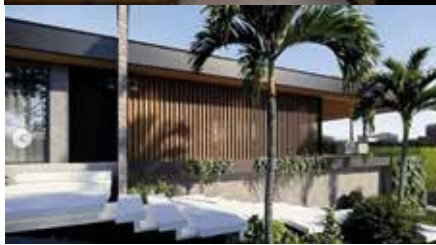
Projetos que integram conhecimento acadêmico e a vivência prática de uma obra.

mais estratégica para empresas que buscam atualização de seus espaços com inteligência e otimização de recursos. Ao mesmo tempo, sua atuação no universo residencial demonstra sensibilidade para interpretar estilos de vida e traduzir expectativas em ambientes que equilibram conforto, identidade e funcionalidade.