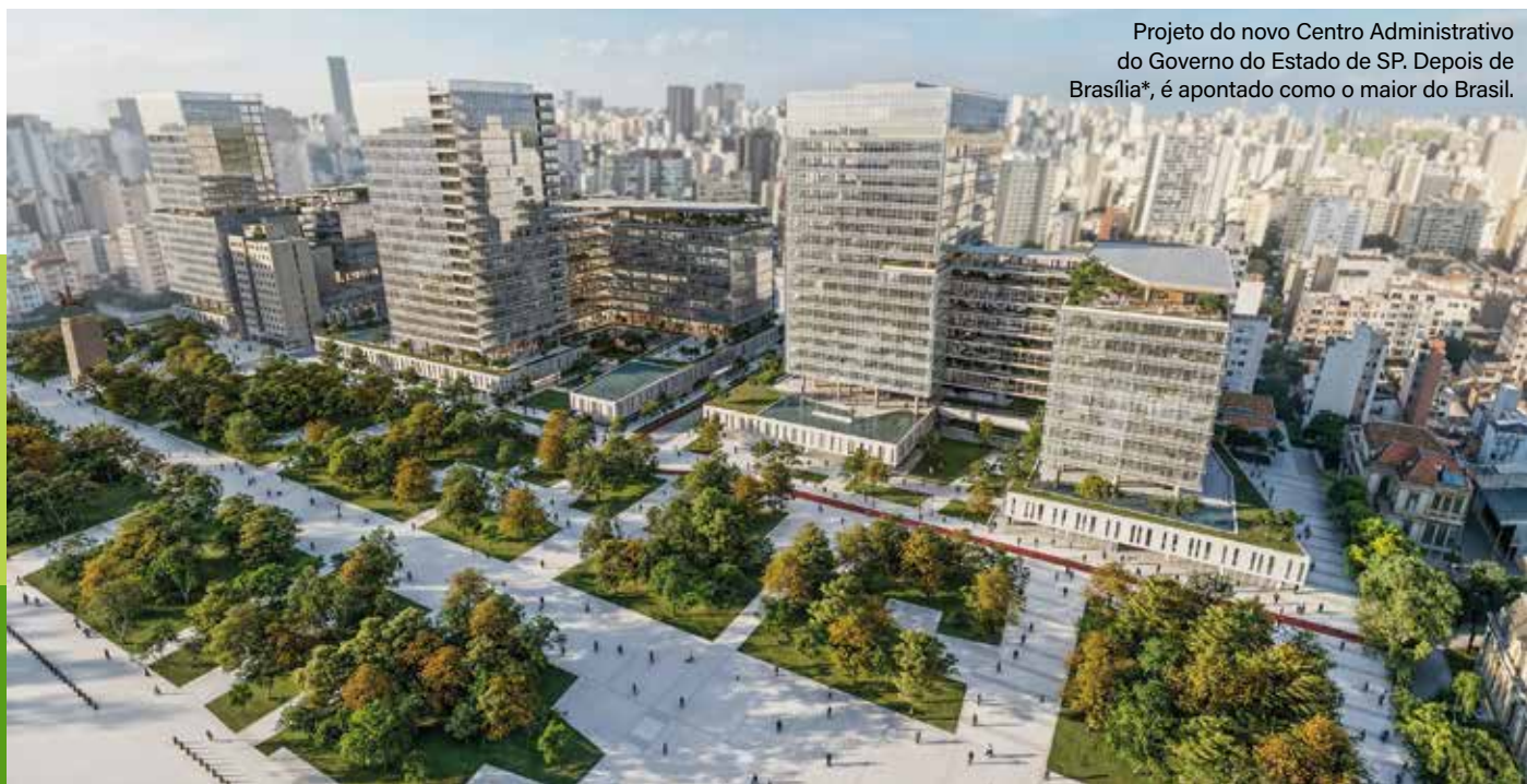
Projeto do novo Centro Administrativo do Governo do Estado de SP. Depois de Brasília*, é apontado como o maior do Brasil.

Ao olhar para trás, da Mooca até aqui, o que emociona não é apenas a conquista, mas o percurso. Um caminho de disciplina e sensibilidade que moldou o olhar de quem entende que cidade boa é aquela que acolhe, integra e permanece viva.