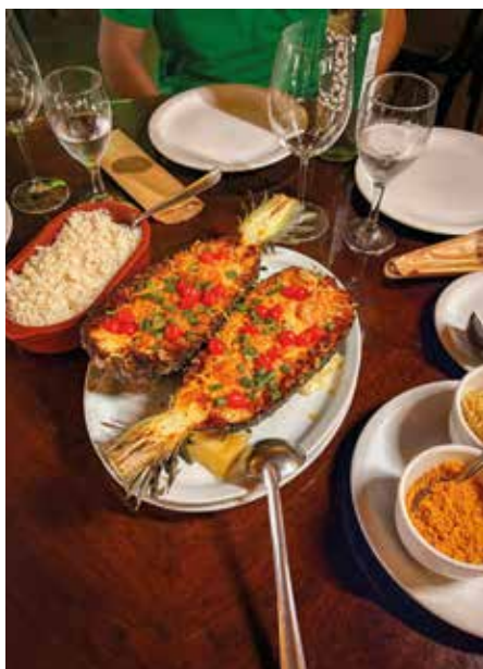
Camarão servido no abacaxi, pode ser provado todos os dias.

Mas essa história começa um pouco antes. Começa na Cachaçaria