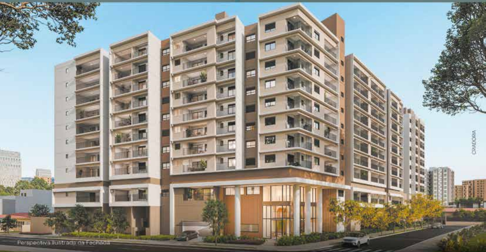
Perspectiva Ilustrada da Fachada