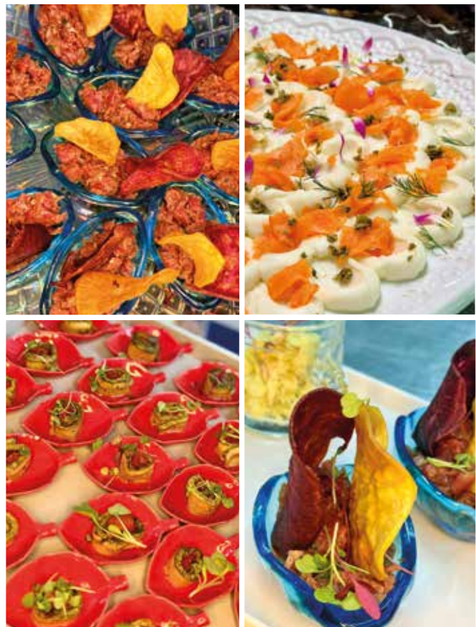
Gastronomia itinerante, cada evento é pensado de forma única, com sensibilidade, cuidado e atenção aos detalhes.